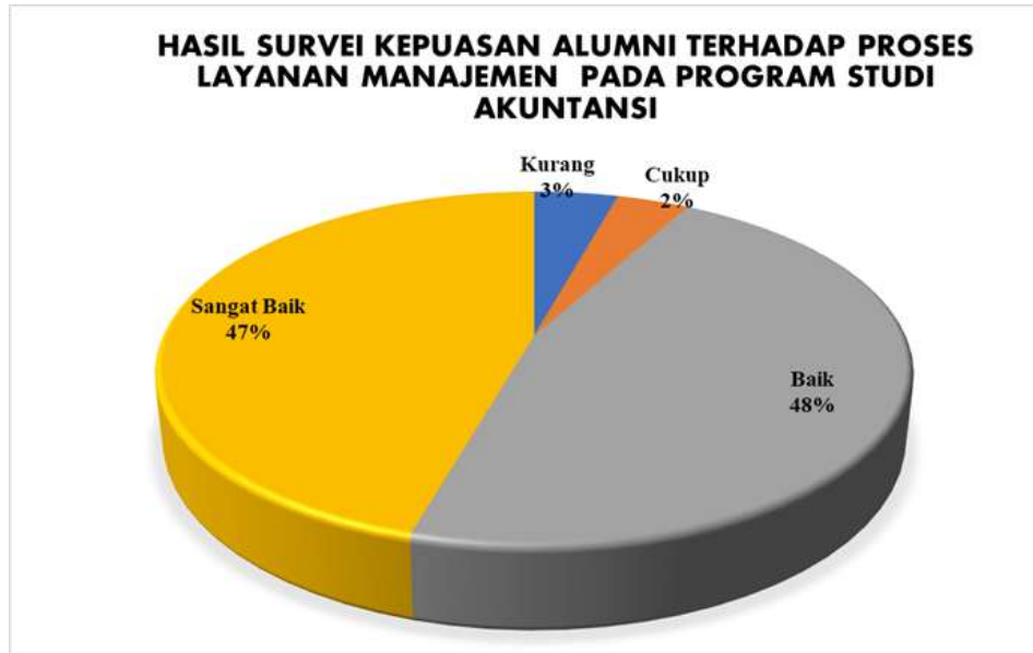
Diagram 4.1 Persentase Hasil Survei Kepuasan Alumni terhadap Proses Layanan Manajemen pada Program Studi Manajemen

Berdasarkan hasil survei dapat dilihat pada Diagram 4.1 yang menggambarkan bahwa secara keseluruhan mahasiswa program studi Manajemen memberikan nilai Sangat Baik sejumlah 47%, nilai Baik sejumlah 48%, nilai Cukup sejumlah 2%, nilai kurang 3%. Jika merujuk pada Tabel 2.3 nilai persentase tersebut berada pada rentang 41-60%, sehingga dapat disimpulkan bahwa kepuasan alumni terhadap proses layanan manajemen di program studi Manajemen masuk pada kategori CUKUP BAIK .